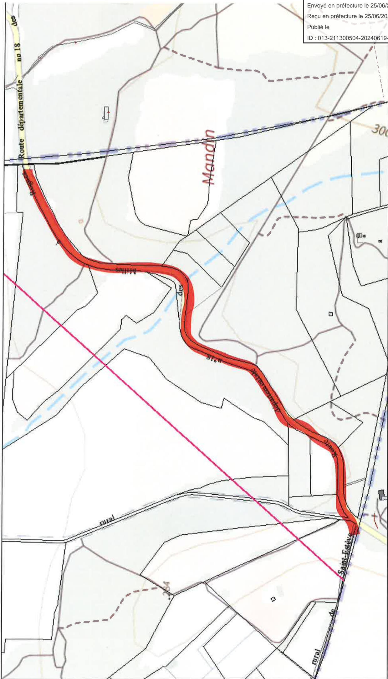
Route de Rognes à Saint Cannat