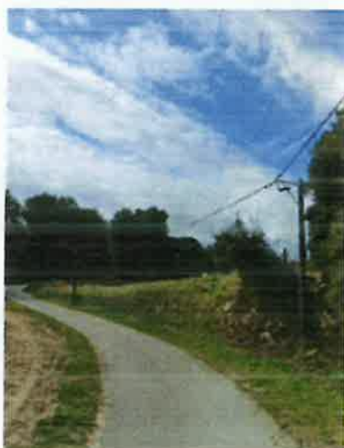
Photo d'ensemble de l'emplacement avec implantation souhaitée