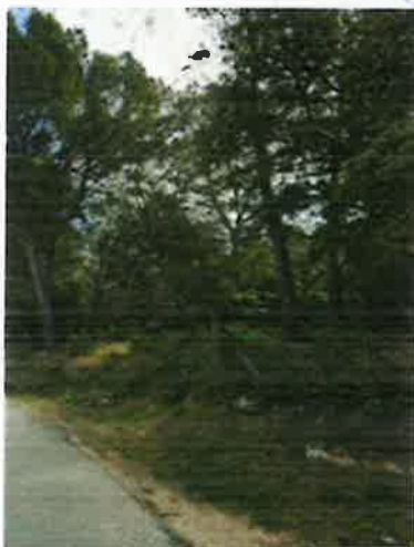
Photo d'ensemble de l'emplacement avec implantation souhaitée