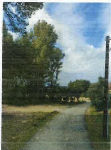
Photo d'ensemble de l'emplacement avec implantation souhaitée