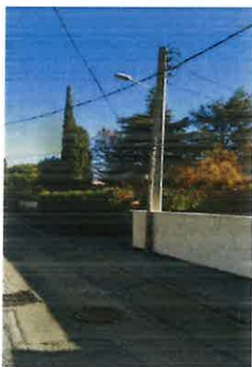
Photo d'ensemble de l'emplacement avec implantation souhaitée