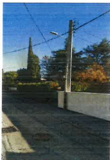
Photo d'ensemble de l'emplacement avec implantation souhaitée